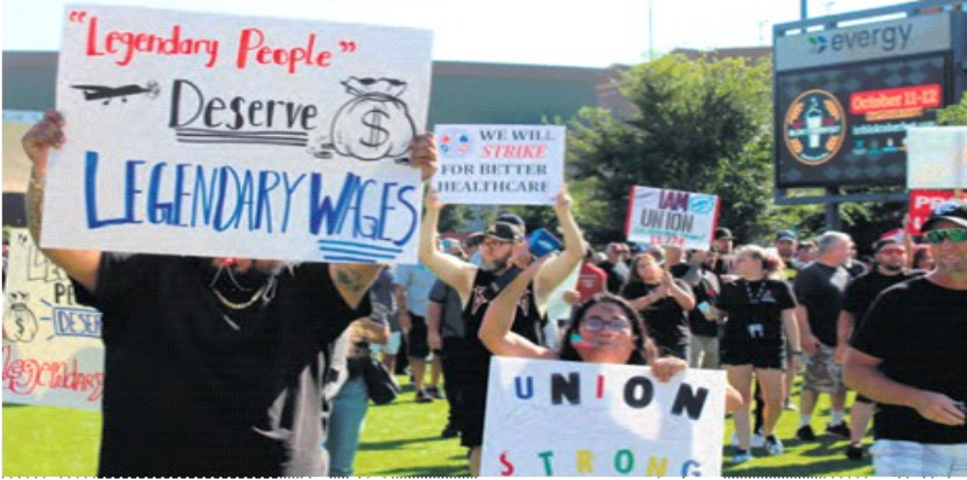
«Efsanevi insanlar efsanevi ücretleri hak eder»

teklifin «en iyi ve son teklif» olduğunu belirterek pes etmeye başladı. IAM sendikasının başkanı patronun verdiği bu ilk tavsiyi memnuniyetle karşıladı ve «bu Boeing işçilerinin başından beri haklı olduğunu gösteriyor» dedi. İki hafta önce sendikasının yüzde 25 lehine oy kullanmalarını tavsiye ettiğini unutmuşu açıklamayı yapmıştı: «Grev giderek daha fazlasını elde edeceğimize inanmıyoruz.»