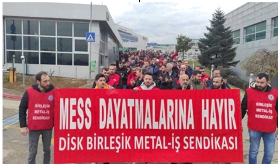
Metal işçi ve emekçilerinin grevi