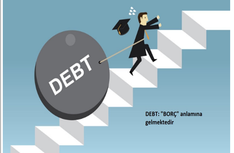
DEBT: "BORÇ" anlamına gelmektedir

Bugünün toplumunda geleceğin işçilerine iyi bir yaşam sunmak için yeterli kaynak, zenginlik ve teknoloji var. Bu bireyleri ve bireylerin ailelerini